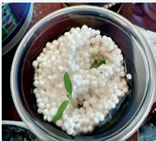
Figura 2. Plántulas de tomate cv. Saladette de 14 días de emergidas, previo al trasplante.

Se trasplantaron dos plántulas por unidad experimental (repetición) (Figura 3). La unidad experimental consistió en una bolsa de 3 kg de capacidad conteniendo alguno de los tres sustratos descritos en el Cuadro 1.