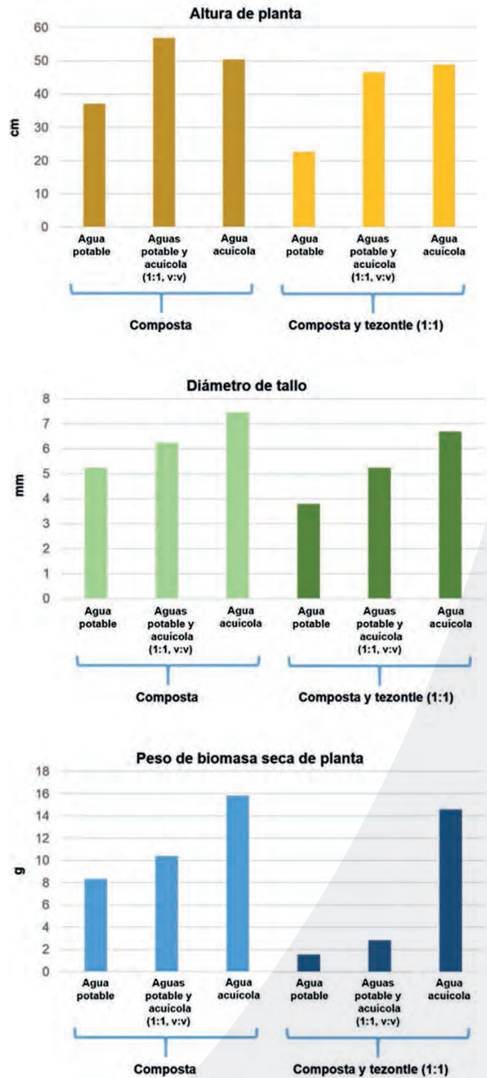
Figura 6. Variables de crecimiento de plantas de Tomate var. Saladette 85 días después de trasplante.