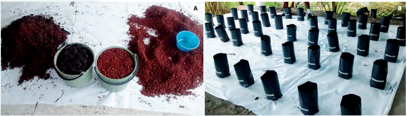
Figura 3. A: Sustratos utilizados. B: Preparación de bolsas con los sustratos para la realización del trasplante.

Cada unidad experimental se regó con 250 mL diarios del agua de riego correspondiente, según se indica en el Cuadro 1. Después de 85 días a partir del trasplante, se evaluaron en las plantas las variables de crecimiento siguientes: altura de planta, diámetro de tallo y peso de la materia seca de plantas.