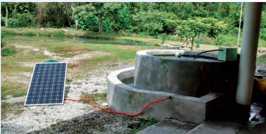
Figura 1. Estanque utilizado en el cultivo de tilapia var. Spring .

Se estableció en un estanque circular de cemento de 2.5 m de diámetro por 1 m de alto (Figura 1), 150 tilapias ( Oreochromis niloticus L.) var. Spring de 30 días de edad (Figura 4A). El estanque contó con una bomba de aireación (DHC80-12S Covron® N°610959 de 12 V Aquatic Eco-Systems, Inc. Since 1978 Diaphragm blower), para la oxigenación de las tilapias diariamente en periodos de entre 3 y 5 horas. La energía para el funcionamiento de esta bomba fue generada a través de un panel solar casero. También se dispuso de una toma de agua potable para realizar los recambios de agua en el estanque; el volumen de