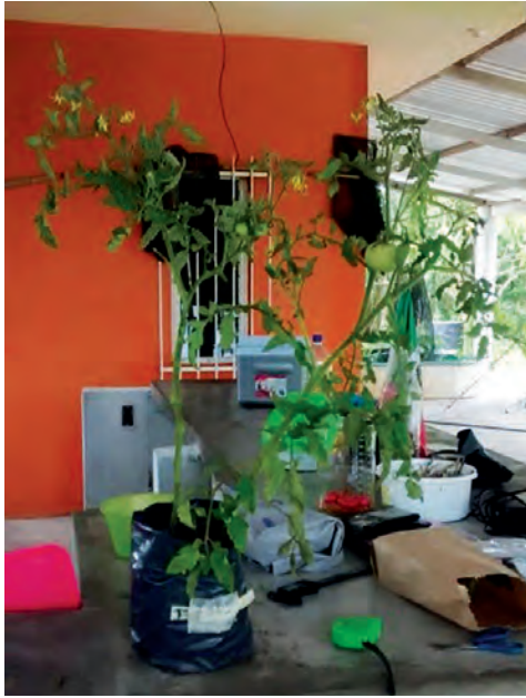
Figura 5. Planta de tomate cv. Saladette establecida en composta y regada con agua acuícola por 85 días.

obtuvo el mayor peso cuando se regó con agua acuícola, seguido del riego con la combinación de agua potable con agua acuícola en el riego (Figura 6).