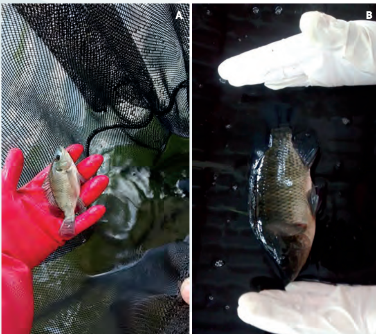
Figura 4. A: Aspecto de las tilapias var. Spring de 30 días, y B: de 85 días de edad.

En lo que respecta a diámetro de tallo, el efecto positivo del riego con agua acuícola se observó en mayor magnitud con el uso de composta y tezontle, que con la composta sola, atribuido a menor oferta de nutrimentos (Figura 6). La misma tendencia fue registrada en el peso de biomasa seca; donde con ambos sustratos se