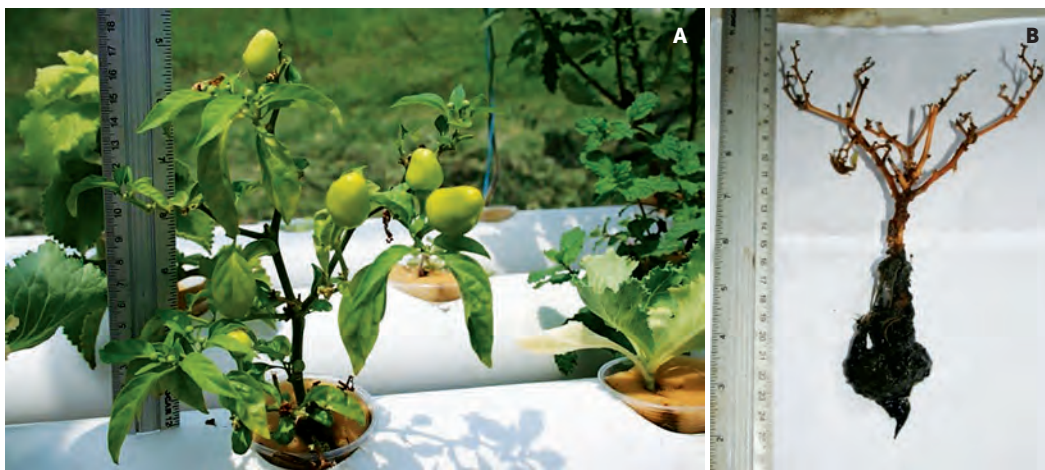
Figura 4. Crecimiento del chile de ornato en acuaponía (A) y siembra tradicional (ST)

tales como, sodio y cloruro. Asimismo es recomendable planificar los eventos que permitan contar con producción constante. En la acuaponía no es necesario la rotación de cultivos, y se puede diversificar tanto en vegetales como en animales, por ejemplo tilapia y camarón. La producción de tilapia en acuaponía permitió una ganancia de peso promedio de 206.01 kg del día 1 al 120, con una tasa de creci-