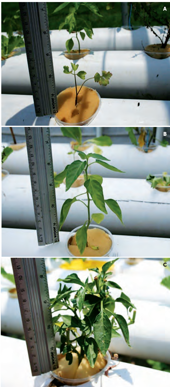
Figura 2. Crecimiento de A: Perejil, B: Chile serrano y C: Chile de ornato en hidroponía.

etapa inicial y de engorda con una dieta comercial con 45% y 35% de proteína cruda, respectivamente. Cada 10 días se evaluó la ganancia de peso en una muestra de 60 peces para estimar el número total de organismos, peso promedio (g), densidad ( \text{kg m}^{-3} ), sobre-