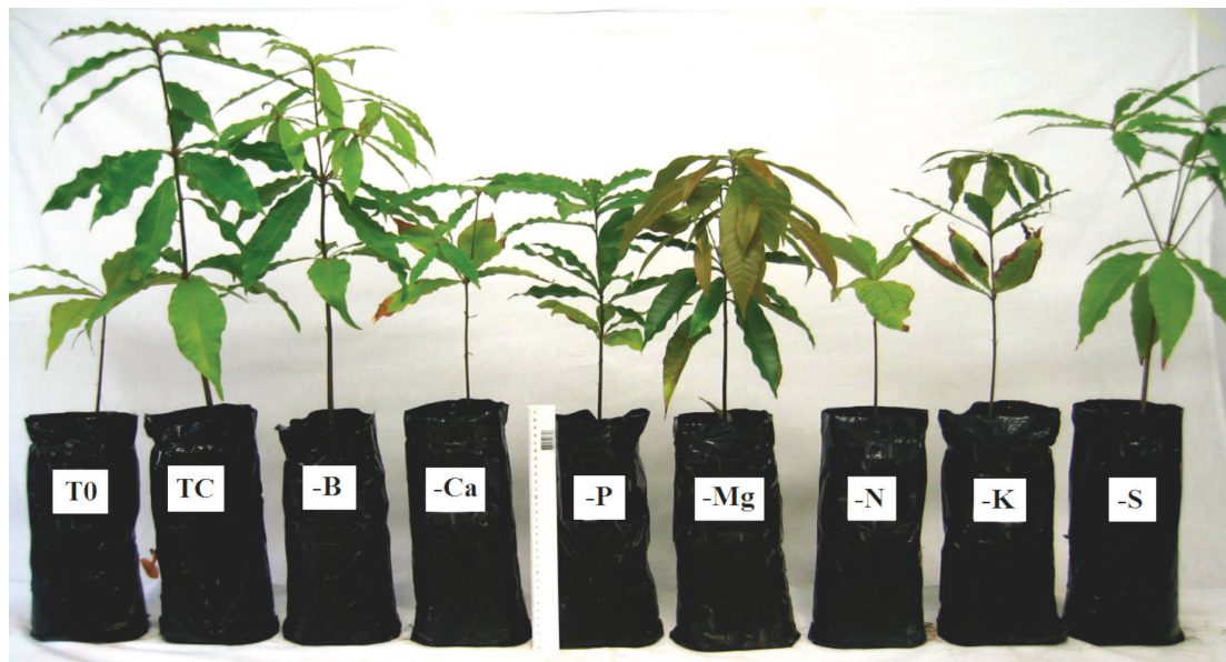
Fig. 1. Aspecto de las plántulas de Q. humboldtii después de 4 meses bajo tratamientos de fertilización en vivero: T0=tratamiento testigo (sin fertilización), TC= completo (con B, Ca, P, Mg, N, K y S), -B=TC menos B, -Ca=TC menos Ca, -P=TC menos P, -Mg=TC menos Mg, -N=TC menos N, -K=TC menos K, -S=TC menos S.

síntomas visuales evidentes de deficiencia nutricional. Estos síntomas comenzaron a expresarse a partir del segundo mes de establecido el ensayo, pero se hicieron completamente notorios al cuarto mes. El efecto de los tratamientos se empezó a hacer evidente sobre la altura de las plántulas, y después aparecieron diferencias en la forma de las plántulas, y en algunas características de las hojas como forma, tamaño, textura y color. Además, se presentaron otros síntomas específicos, relacionados con la forma de las quemazones y los tipos de clorosis, entre otros (Figuras 1 y 2). La mayoría de estos síntomas visuales de deficiencias nutricionales se han reportado para otras especies forestales; no obstante, cada especie puede mostrar tales deficiencias de forma particular y con diferente intensidad (Sarcinelli et ál. 2004, Wallau et ál. 2008).