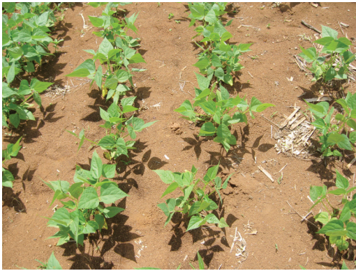
Fig. 1. Condición del terreno en una rotación chile picante-frijol. Pueblo Nuevo, Buenos Aires, Costa Rica. 2009.

aplicaciones de nematicidas, lo que podría contribuir a reducir las poblaciones del nematodo. En muchas ocasiones, el productor prepara el suelo antes de sembrar el chile picante, lo que puede incidir en la disminución de las poblaciones de A. besseyi por la incorporación de los rastrojos. Al respecto, Brmež et al. (2006) indicaron que las poblaciones del género Aphelenchoides decrecen significativamente después de arar el suelo.