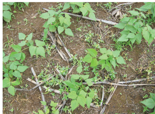
Fig. 5. Cantidad de rastrojos en una rotación maíz-frijol. Veracruz, Pérez Zeledón. 2009.