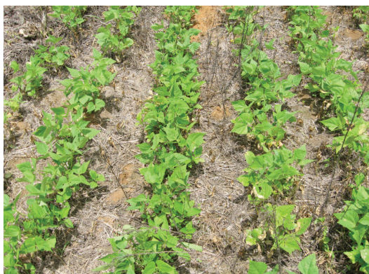
Fig. 3. Cobertura de rastrojos en una rotación ayote-frijol. Veracruz, Pérez Zeledón, Costa Rica. 2009.

2011), la diferencia pudo deberse a la cantidad de nematodos presentes en los rastrojos antes de la siembra (Figuras 4 y 5), que cumple la función de inóculo primario y por lo tanto podría regular el nivel de incidencia de amachamiento en el frijol. Al respecto, Barrantes (2006), encontró en sus investigaciones que en 10 g de follaje de frijol, en promedio, se contabilizaron 350 nematodos, mientras que en la misma cantidad de follaje de arroz, solo se cuantificaron 16 individuos; lo que demuestra que los residuos de frijol son reservorios más efectivos del nematodo. En cuanto a maíz, McSorley y Frederick (1999) encontraron en sus investigaciones que en suelos donde se agregaron rastrojos de maíz como enmienda