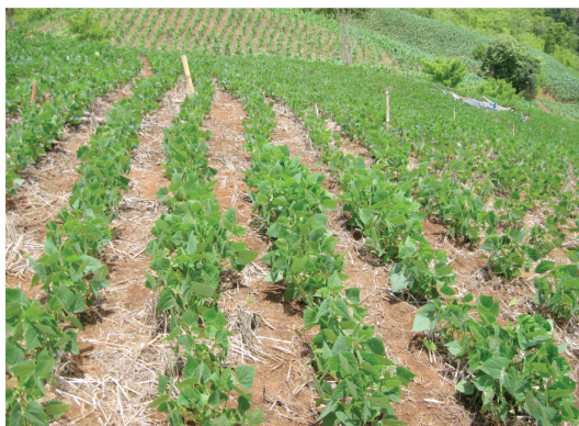
Fig. 4. Cantidad de rastrojos en una rotación arroz-frijol. Concepción, Buenos Aires, Costa Rica. 2009.

Otro aspecto importante que se notó durante la observación de campo fue la distribución diferencial de la enfermedad, mientras que en las rotaciones tiquizque-frijol y jengibre-frijol solo se presentaron focos aislados de la enfermedad en la rotación maíz-frijol, las plantas de frijol con amachamiento se encontraban distribuidas al azar en toda el área de cultivo. Este es un aspecto importante de considerar para el manejo de