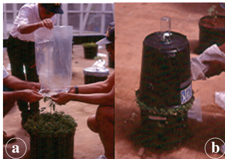
Fig. 3. Métodos para el muestreo de los adultos presentes en la planta de tomate, mediante una bolsa plástica (a), así como en las coberturas vivas, mediante un balde (b).