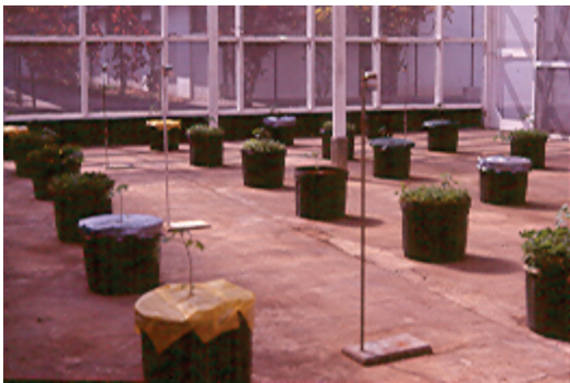
Fig. 1. Disposición de los tratamientos en el invernadero. Nótese los postes metálicos para la liberación de los adultos.

Se utilizó un diseño completamente aleatorizado, dadas las condiciones homogéneas en