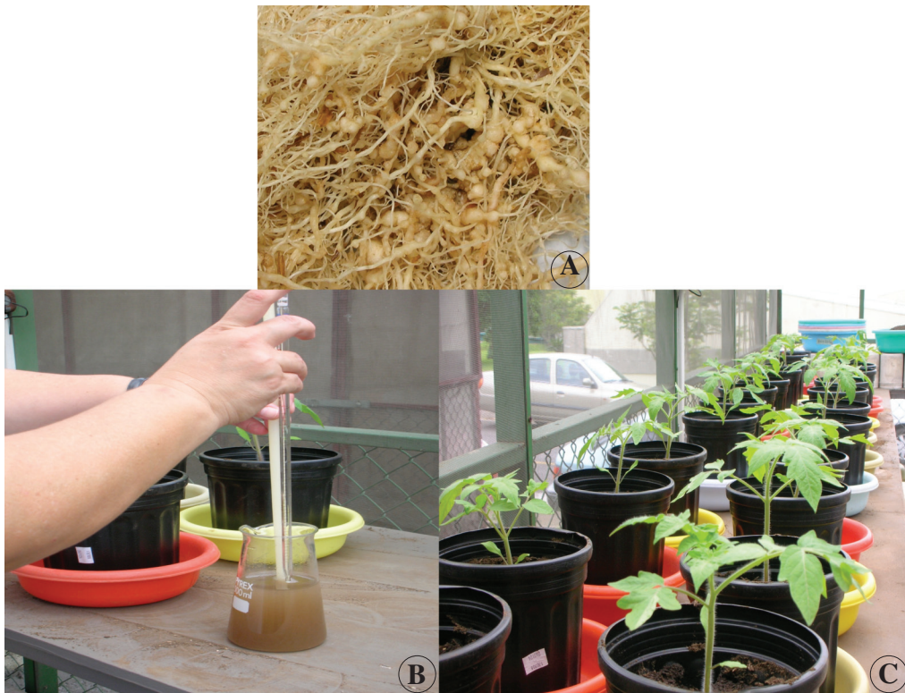
Fig. 1. Inoculación del nematodo. A. Sistema radical de tomate donde se incrementó el inóculo de Meloidogyne incognita para la investigación (edad 75 días). B. Suspensión de nematodos (huevos+J2) utilizada en la investigación. C. Plantas de tomate var. Hyslip, 7 días después del trasplante, preparadas para la aplicación de los nematodos.

Índice de Masas de Huevos (IMH) (escala 0=0, 1=1 a 2, 2=3 a 10, 4=31 a 100 y 5=más de 100 masas de huevos). Posteriormente cada sistema radical se cortó en trozos de aproximadamente 1 cm y se procesó con hipoclorito de sodio al 1% para obtener la población (huevos y juveniles en segundo estado) por medio de cribas de 0,150 y 0,025 mm (N° 100 y 500 mesh). Se obtuvo además el Factor de Reproducción (FR=Población final /Población inicial) de M. incognita .