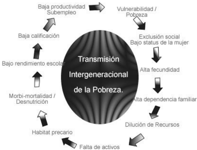
Gráfico 2: Interacciones población/vulnerabilidad y pobreza.

Las desigualdades finales serían aquellas que provienen del resultado de la participación de los individuos en la vida social en general, y en el mercado laboral en particular, el cual resulta en un estatuto o un lugar en la estratificación social. Sin embargo, los grupos de población con más necesidades básicas insatisfechas son quienes reproducen la transmisión intergeneracional de la pobreza (Ver gráfico 2).