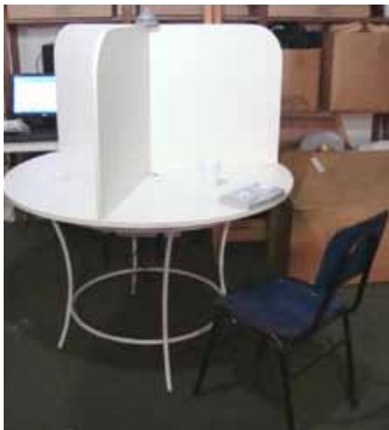
Figura 1. Aparato experimental.