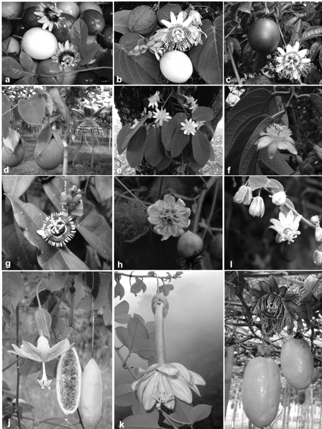
Figura 2. Principales especies cultivadas y silvestres en el departamento del Huila: subgéneros Passiflora (a, P. edulis f. flavicarpa ; b, P. ligularis ; c, P. edulis f. edulis ; d, P. maliformis ; e, P. quadrangularis ), Astrophea (f, P. arborea ), Decaloba (g, P. coriacea ), Dysosmia (h, P. foetida ), Tryphostemma (i, P. gracillima ) y Tacsonia (j, P. tarminiana ; k, P. cumbalensis ).

huilenses y con denominación de origen, aunque es poco lo que se conoce de ella, como su distribución natural, la biología reproductiva, la variabilidad genética y otros posibles usos potenciales en la industria alimentaria o farmacopea.