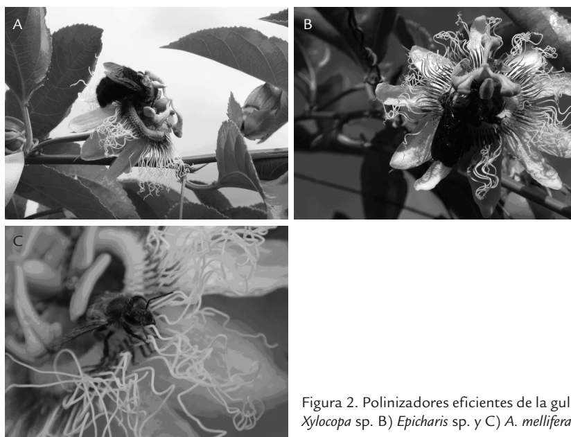
Figura 2. Polinizadores eficientes de la gulupa. A) Xylocopa sp. B) Epicharis sp. y C) A. mellifera .

386 Artículo - Efectos de la variación altitudinal sobre la polinización en cultivos de gulupa ( Passiflora edulis f. edulis ). Medina-Gutiérrez, et ál.